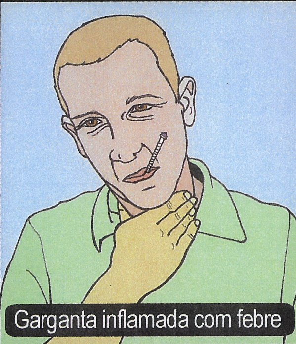
Garganta inflamada com febre